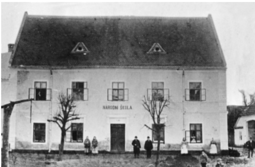
Stará školní budova na náměstí.

Roku 1902 bylo nutné otevřít čtvrtou třídu na radnici. Bylo potřeba řešit