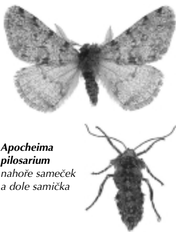
Apocheima pilosarium nahore sameček a dole samička

Sameček má přední křídla šedohnědá (délka až 2 cm), hnědě tečkovaná a skvrnitá s nezřetelnými příčkami. Zadní křídla bývají jasnější a příčky jsou zřetelnější. Na předních, ale ještě zřetelněji na zadních křídlech se na-