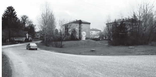
Na první fotografii je ulice Dlouhá ( Nádražní, Žabí ) ráno při poslední velké povodni 27.června 1987

Druhá je pořízená ze stejného místa v roce 2009.