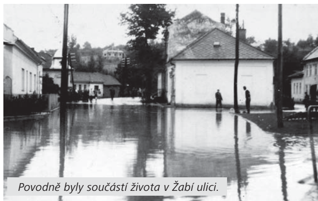
Povodně byly součástí života v Žabí ulici.