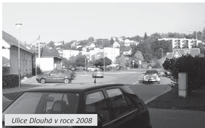
Ulice Dlouhá v roce 2008