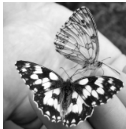
Okáč bojínkový ( Melanargia galathea Linné, 1758) sající lidský pot.

Předkládaný seznam vychází z příloh vyhlášky ministerstva životního prostředí ČR č. 395/1992 Sb., která přináší přehledy zvláště chráněných druhů živočichů. Do seznamu byly zahr-